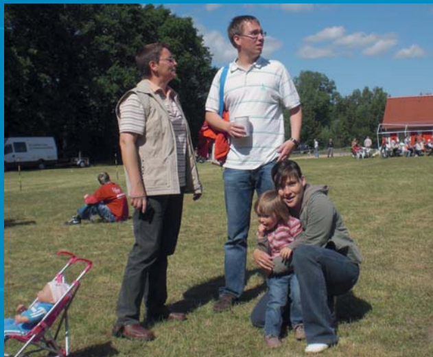
Das Ehrenamt muss unterstützt und gewürdigt werden